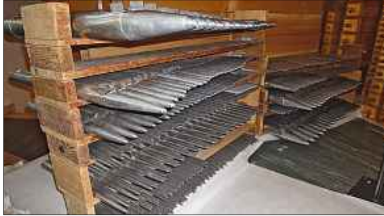
Über 3000 Pfeifen werden ausgeweidet, aufgestapelt und geputzt.

Die Orgel in der Kirche St. Anton muss dringend generalüberholt werden.