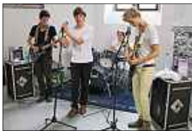
An der offiziellen Feier der Jugendberatungsstelle Contact spielte die junge Luzerner Band «Symbol of Wisdom».

pd. Die Luzerner Jugend- und Familienberatung «Contact» feierte Anfang September ihr 40-Jahr-Jubiläum. Seit Gründung hat die Beratungsstelle rund 6000 Familien und Jugendliche unterstützt.