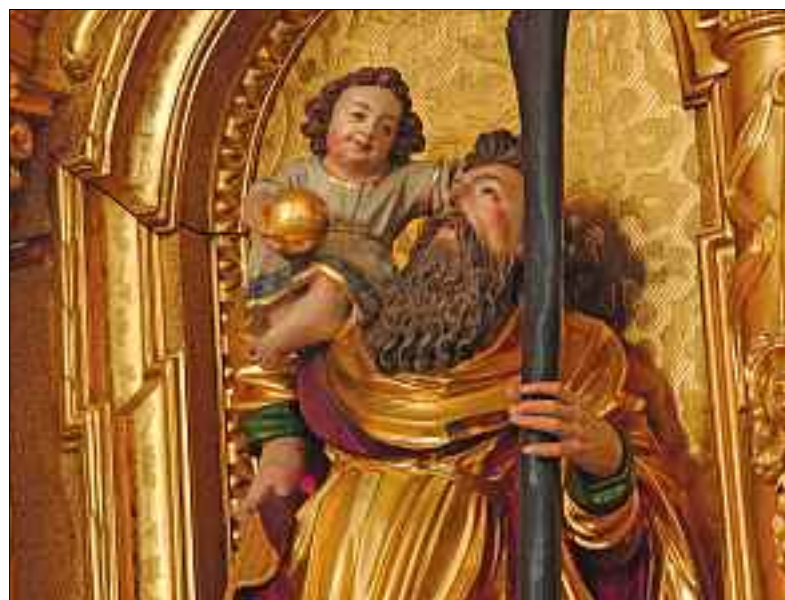
Der heilige Christophorus und das Jesuskind. Detail des Christophorus-Altars in der Hofkirche St. Leodegar.