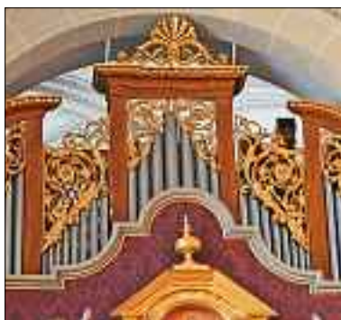
Prospekt der Walpenorgel im Chor der Hofkirche St. Leodegar.