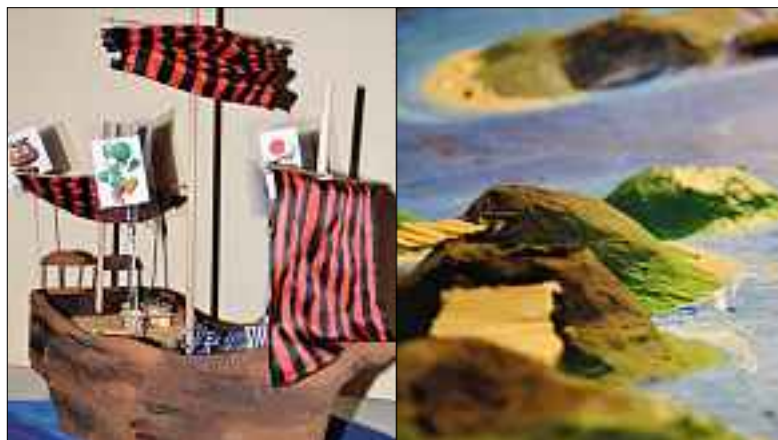
Das «Piratenschiff» hat verschiedene Inseln angesteuert.