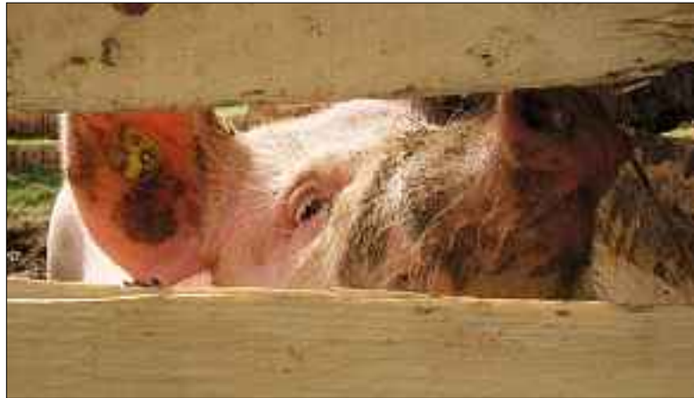
Jede und jeder ein Star – na klar! Auch dieses herzige Säuli könnte es schaffen. Starpotenzial hat es jedenfalls.

ms. In den Herbstferien geht es wieder lustig zu und her im Tageslager für Schulkinder und Jugendliche.