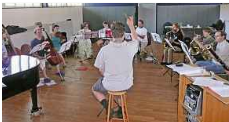
Musikerinnen und Musiker proben seit Ende der Sommerferien regelmässig.

Musik, Theater und Essen sind meistens lustvoll. Das Theater im Paul kombiniert diese drei Dinge an einem Abend und lädt Sie alle ganz herzlich dazu ein!