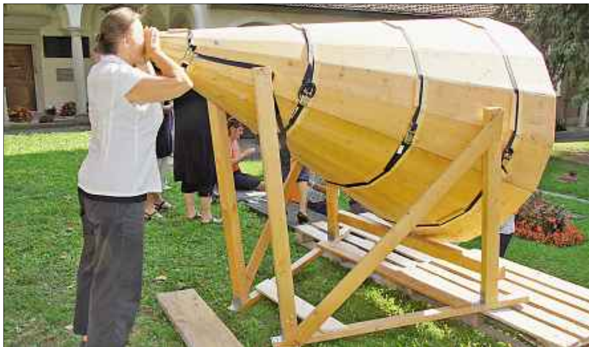
Stadtsegen bei der Hofkirche. Durch solche Trichter, sogenannte «Follen», wird der Segen in die Stadt gerufen.

«Bedrohen uns fremde Religionen?» Unter diesem Titel diskutierten am Tag der Eröffnung der neuen Universität Luzern drei Theologen und ein Politikwissenschaftler. Seite 3