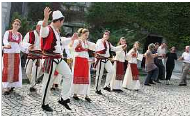
Gemeinsam feiern und tanzen – Patrozinium 2009.

Unterschiede trennen uns nicht, sie bringen uns zusammen. Anlässlich des Patroziniums der Pfarrei St. Michael am Sonntag, 25. September feiert auch die katholische Albanermission mit.