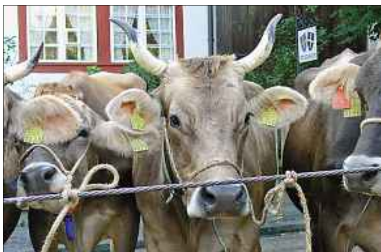
In froher Erwartung. Kühe an einer Viehschau.

Parallel dazu ist der Preis für Milch regelmässig gesunken. Dies wiederum hat dazu geführt, dass die Bauern immer mehr Kühe pro Fläche halten und immer mehr Futter von aussen begeben müssen. Mit dem Ausstoss von Methangas