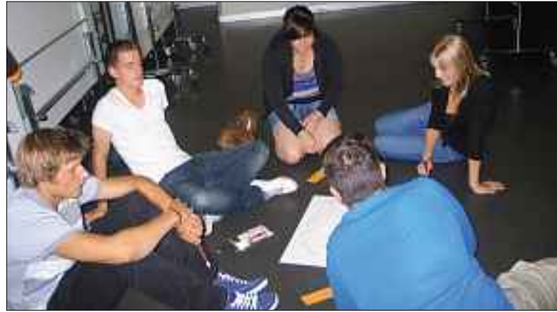
Jugendliche beim Diskutieren.

Bereits zum vierten Mal feiern wir die Firmung mit der Nachbarspfarre St. Karl.