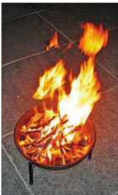
Feuer kann für die inspirierende Geisteskraft Gottes stehen.

Das Sakrament der Firmung steht im Spannungsbogen zwischen einem traditionell gewachsenen christlichen Bekenntnis als Ausdruck religiöser Identität und der Ermutigung zu einer eigenen religiösen Mündigkeit.