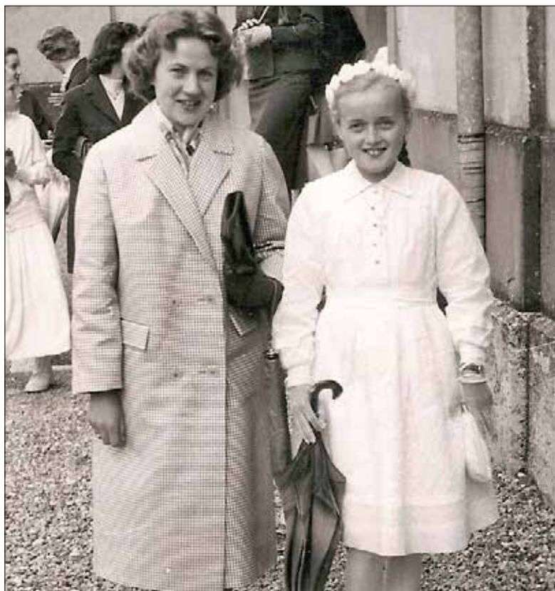
Firmung in den Sechzigerjahren des 20. Jahrhunderts. Rechts die Grossmutter von Anouk Probst mit ihrer Firmgotte.