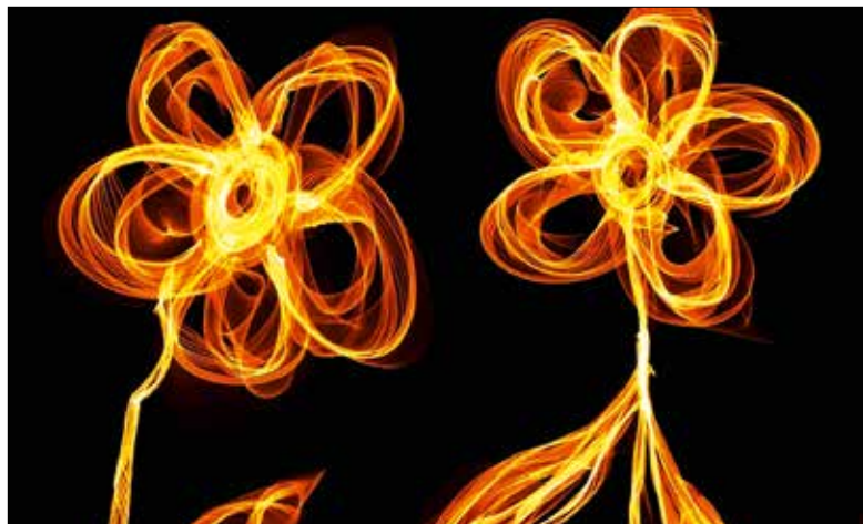
«Füür was blüesch?» ist das Motto der Firmung 2017.

Der Heilige Geist kommt zu Besuch im St. Karl / St. Josef. Er lodert und blüht.