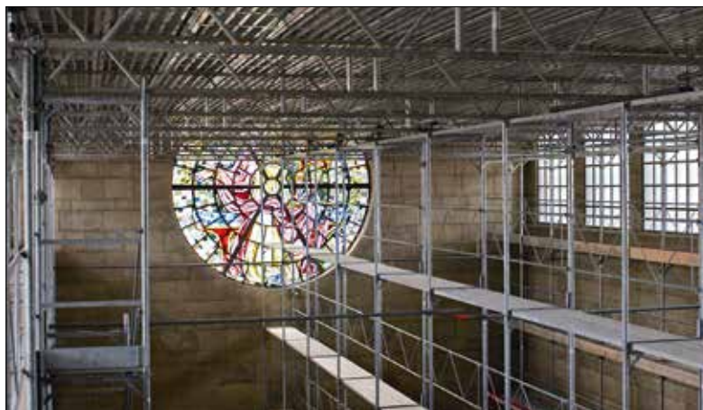
Professionell geleitet und verwaltet, ist die Kirche auch gerüstet für die Zukunft.

Seit dem Amtsantritt von Papst Franziskus hat sich an der Kurie einiges verändert.