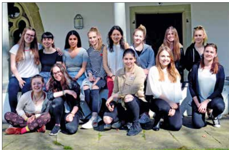
Die Gruppe der jungen Frauen des aktuellen Firmkurses.

Firmanden der Pfarreien St. Maria zu Franziskanern und St. Paul haben sich auf dem Firmweg mit dem Thema des eigenen Feuers auseinandergesetzt.