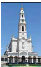
Die Basilica Antiga von Fatima.

Unter ihnen auch Francisco Marto (1908–1919) und Jacinta Marto (1910–1920), die Seher-Kinder von Fatima. Ihnen soll erstmals am 13. Mai 1917 bei Fatima die Muttergottes erschienen sein. Die Heiligsprechung erfolgt im Rahmen eines Papstbesuches im portugiesischen Wallfahrtsort am 12. und 13. Mai, an dem Franziskus der vor 100 Jahren begonnenen Visionen gedenkt.