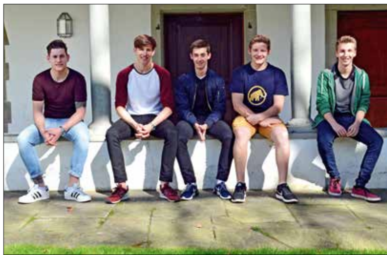
Die Gruppe der jungen Männer des aktuellen Firmkurses.

Junge Frauen und Männer empfangen am 13. Mai das Sakrament der Firmung. Ein Firmand teilt uns seine Erfahrungen zum Firmweg mit.