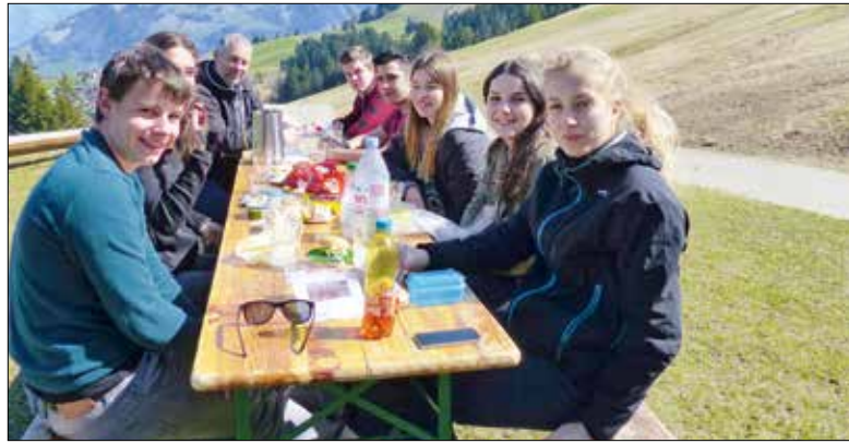
Am Firmweekend Anfang April auf dem Wirzweli.

Am 14. Mai werden 14 Jugendliche aus den Pfarreien St. Josef und St. Karl gefirmt. Einer von ihnen beantwortet im Interview die Frage aus dem Titel.