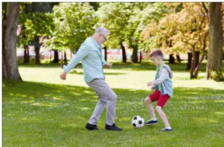
Begegnung im gemeinsamen Spiel.

Spielen macht Spass und verbindet Menschen unterschiedlichen Alters und unterschiedlicher Herkunft. Der Generationenpark Hirtenhof bietet einen idealen Rahmen dazu.