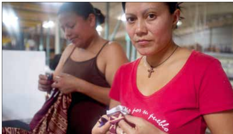
Die Arbeitsbedingungen von Fabrikarbeiterinnen in Zentralamerika sind oft miserabel.

Wie Selma ergeht es Tausenden von Arbeiterinnen in Zentralamerika. Sie schufteten in Textilfabriken oder in der Heimarbeit. Doch die Arbeitsbedingungen und der Lohn