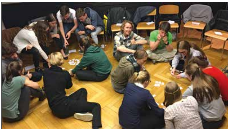
Die Firmlinge diskutieren ihre Gottesbilder.

Sie erreichen alle Mitarbeitenden via E-Mail nach folgendem Muster: vorname.name@kathluzern.ch