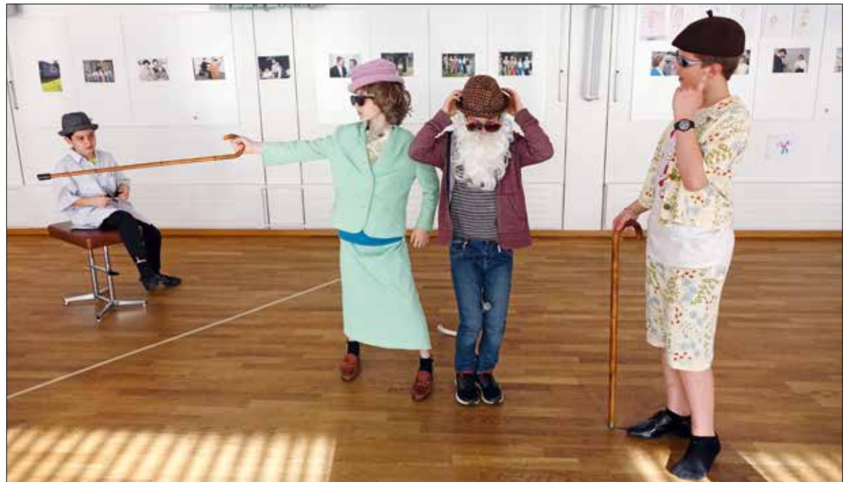
Aus Jung mach Alt. In einem Atelier an den Ethikhalbtagen wurde Theater gespielt.