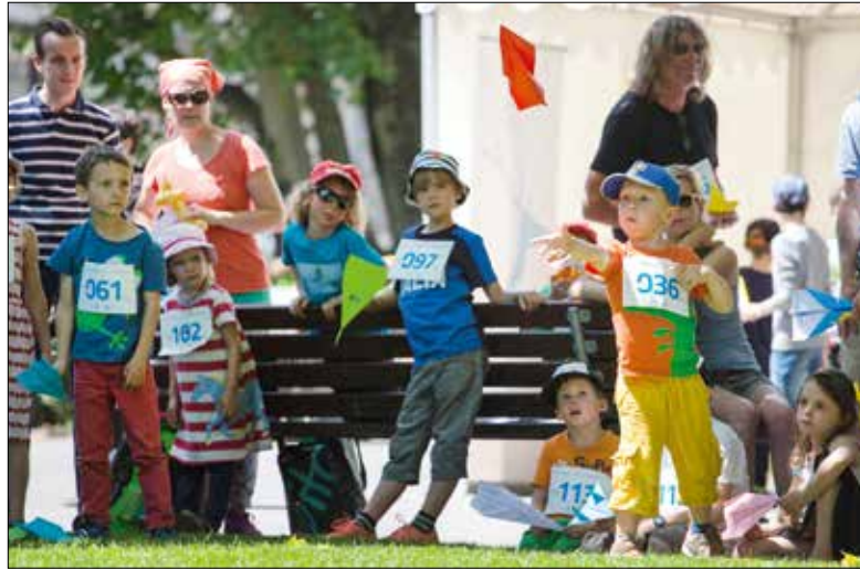
Nicht nur für die Kinder ein jährliches Highlight: die Papierflugi-Meisterschaft im «Vögeligärtli».

Alle Jahre wieder wird das «Vögeligärtli» zum Schauplatz eines besonderen Spektakels: An der Papierflugi-Meisterschaft wurden auch diesmal wieder die besten Pilotinnen und Piloten der Region gesucht. Dank optimalem Flugwetter wurde nicht nur ein Distanz-, sondern auch ein Teilnehmer-Rekord verzeichnet.