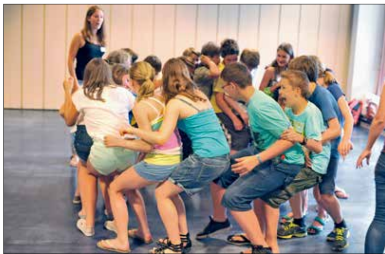
Vorbereitung für den grossen «Jump».

Auch dieses Jahr begleiten die Religionslehrpersonen und Jugendarbeiter den Übertritt («Jump») der über 50 Sechstklasskinder in die Oberstufe oder ins Gymi.