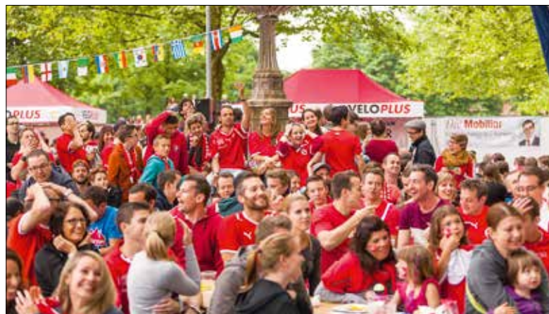
Gemeinsam die Fussball-Europameisterschaft verfolgen und dabei Gutes tun: Das Public Viewing in der «Ufschötti» machts möglich.

Die Arena in der «Ufschötti» bietet wiederum Platz für 800 Fussballfans und beste Biergartenstimmung. Der Eintritt kostet 5 Franken, wobei man einen Jeton im Wert von 2 Franken erhält, den man spenden oder für ein kühles Bier