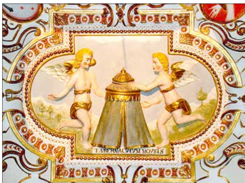
Zwei geschnitzte Engel in der Franziskanerkirche.

1 Kön 19, 16b. 19–21; Gal 5, 1. 13–18 Lk 9, 51–62