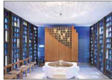
Taufbecken in der Kapelle St. Anton.