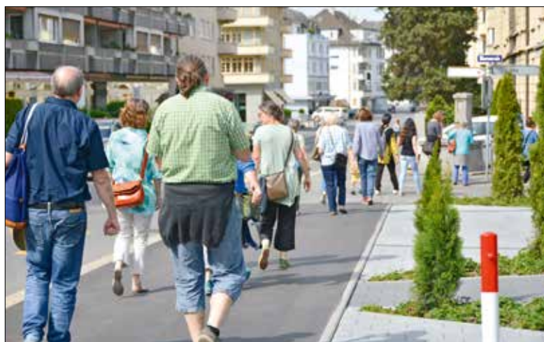
Auf einem Quartierrundgang der anderen Art erzählten die Mitwirkenden des Projekts «Blickwinkel» den Besucherinnen und Besuchern des MaiFestes ihre Geschichten zu Orten, die ihnen viel bedeuten.

Frauen und Männer berichten von ihren Lieblingsorten im Quartier und von ihren Erinnerungen an vergangene Zeiten oder an ihre frühere Heimat.