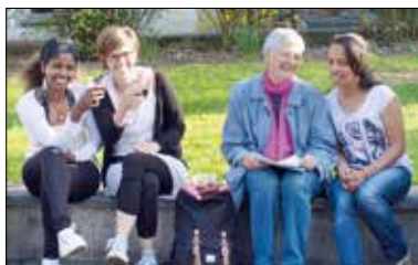
«Melodie des Lebens»: ein Theaterstück von Migranten und Einheimischen.

Am Benefizanlass für die Kontakt- und Beratungsstelle Sans-Papiers Luzern kommt das Theaterstück «Melodie des Lebens» zur Aufführung. Das Besondere an diesem Theaterstück ist, dass es von Migrantinnen und Migranten sowie Einheimischen erarbeitet und einstudiert wurde. Es thematisiert damit nicht nur die Integration, sondern ist vielmehr selbst ein Stück gelebter Integration. Die Kollekte kommt vollumfänglich der Tätigkeit der Kontakt- und Beratungsstelle Sans-Papiers Luzern zugute. Nach dem Theaterstück bietet ein Apéro die Möglichkeit mit den Akteurinnen und Akteuren ins Gespräch zu kommen und sich über das Theater auszutauschen. Sonntag, 26. Juni, 17.00, Treffpunkt: Pfarreisaal St. Anton