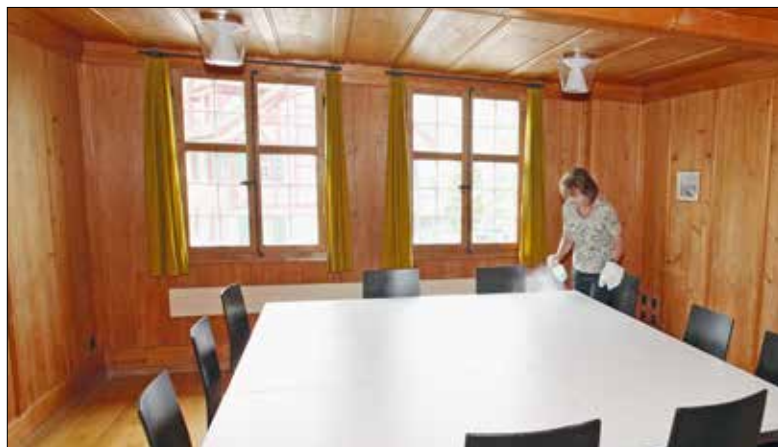
Agnes Affentranger bei der Reinigung eines Zimmers im altherwürdigen Rothenburgerhaus.

Sie erreichen alle Mitarbeitenden via E-Mail nach folgendem Muster: vorname.name@kathluzern.ch