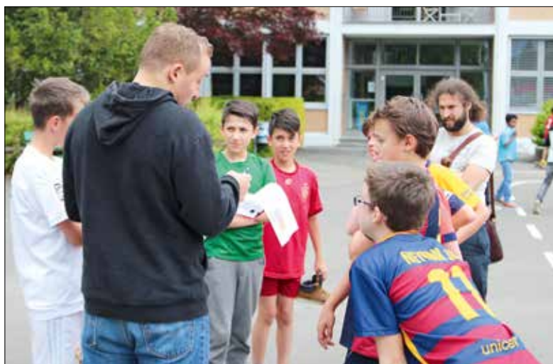
Nach jedem Spiel werden gemeinsam die Fairplay-Punkte vergeben.