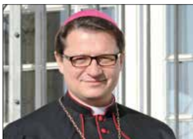
Bischof Felix Gmür lädt die Jubilare zu einem Festgottesdienst ein.

Bischof Felix Gmür lädt auch im Jahr 2016 diejenigen Paare zu einem Festgottesdienst ein, welche dieses Jahr das Jubiläum der «Goldenen Hochzeit» feiern dürfen. Bei dieser Feier danken die Jubilare Gott für diese Gnade und beten für weitere glückliche Jahre. Die formelle Einladung mit den Details zur Anmeldung folgt zu einem späteren Zeitpunkt. Vorerst werden die Paare, die dieses Jahr 50 Jahre verheiratet sind, gebeten, sich das Datum vorzumerken. Samstag, 3. September, 15.00, Pfarrikirche St. Martin, Solothurerstrasse 26, 4600 Olten