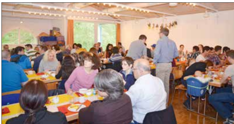
Büttenen-Zmorge 2015: Bei Regen im Büttenentreff statt auf dem Platz.

Die Büttenen-Kommission BÜKO schafft im Büttenenquartier Gelegenheiten der Begegnung und leistet so einen Beitrag zu mehr Lebensqualität.