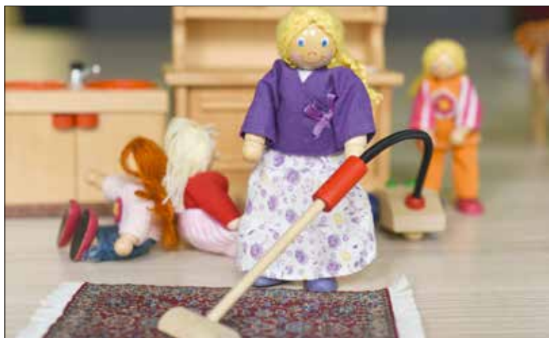
Alleinerziehende sind von Familienarmut besonders häufig betroffen.