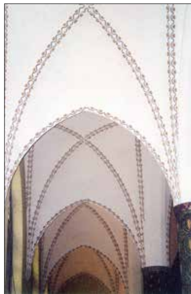
Säule und Deckengewölbe der Pauluskirche mit Ornamenten.