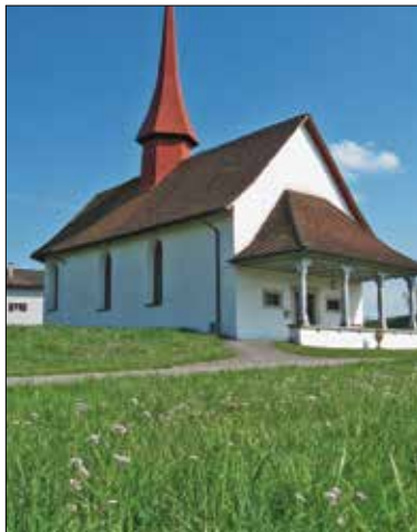
Die Kapelle Adelwil ist ein Wallfahrtsort der 14 Nothelfer.

Die diesjährige Maiandacht führt in die Kapelle Adelwil in Sempach-Station.