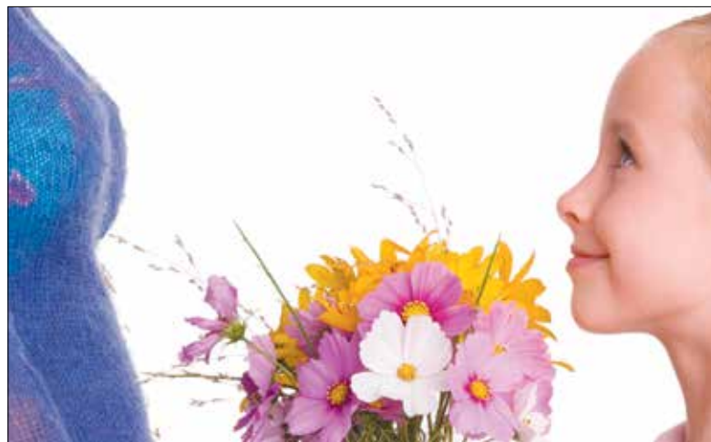
Geht es an Muttertag um mehr als um einen Hausfrauen-Ehrentag? Der Muttertag gibt Gelegenheit, über die Mutterrolle nachzudenken.

Mutter werden birgt ambivalente Gefühle. Über die berühmten prä- und postnatalen Schwankungen macht man sich nicht selten lustig. Doch so ein Vorgang ist kein Spaziergang. Weltweit sterben täglich etwa 1000 Frauen an den Komplikationen während oder nach der Geburt. Auch am Muttertag. Ein Faktum, auf das die «Schweizer Mutternacht» aufmerksam machen will (siehe Agenda, Seite 15).