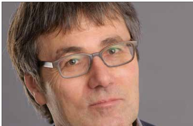
Der Komponist Carl Rütti lebt im Kanton Zug.