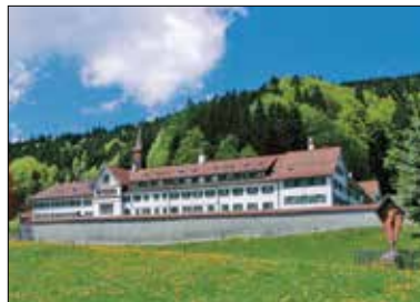
Wohltuende Frühlingsstimmung beim Kloster in der Au.