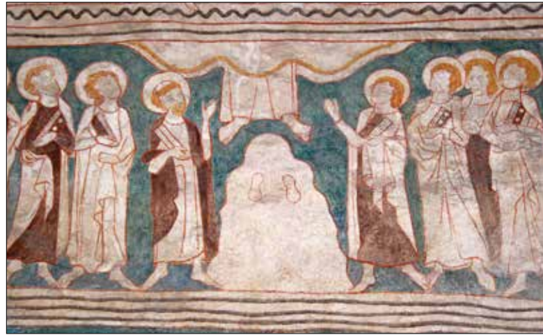
Darstellung von Christi Himmelfahrt in der Kirche St. Niklausen im Kanton Obwalden.

Jener, der uns «ein Stück vom Himmel» brachte – von dem wir Christinnen und Christen sagen «dich schickte der Himmel» – der kehrt an Auffahrt wieder dorthin zurück.