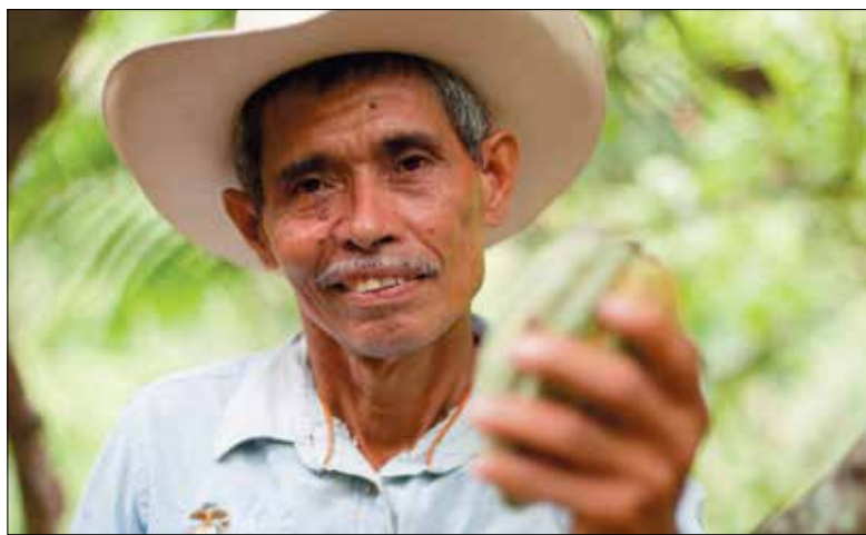
Er produziert auch für uns: Kakaobauer in Honduras.