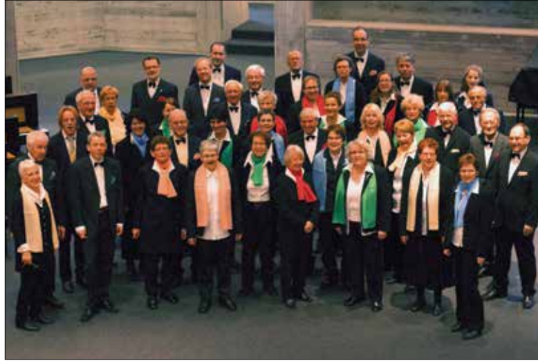
Die 46 Sängerinnen und Sänger des Johannes-Chors.

Am 24. und 25. Mai, um 20.00 lädt der Johannes-Chor in den Würzenbachsaal zu einer Mai-Serenade mit Chorgesang und Instrumentalmusik ein.