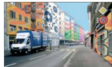
Die Vision: Ein farbiges Quartier.