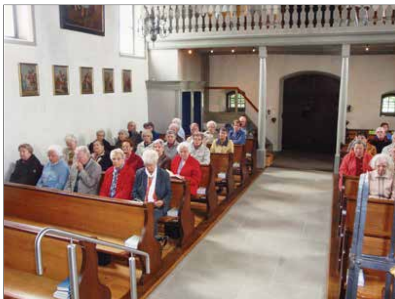
Interessierte Zuhörende bei der letztjährigen Maiandacht in Maria Zell.

Die diesjährige Frühlingsausfahrt für Seniorinnen und Senioren führt ins Benediktinerinnenkloster in der Au nach Trachslau bei Einsiedeln.