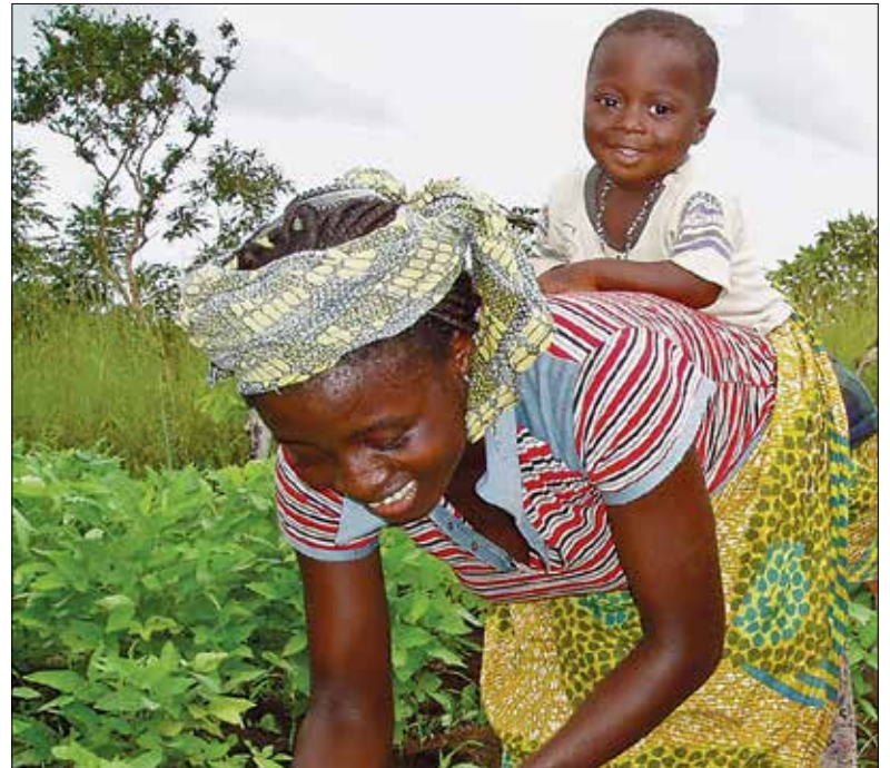
«Brücke – Le pont» unterstützt die Eltern in ihrer Arbeit, damit sie den Kindern geben können, was sie brauchen.

Die Unterstützung der Eltern ist nicht nur in ökonomischer, sondern auch in pädagogischer und psychologischer Hinsicht das Beste für die Kinder. Mit einer einträglichen Arbeit kön-