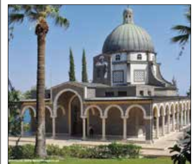
Berg der Seligpreisung am See Genezareth.