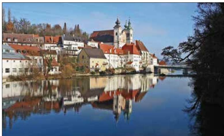
Steyr, die mittelalterliche Stadt zwischen den Flüssen Enns und Steyr.

Wenn einer eine Reise tut, so kann er was erzählen. Zum Beispiel von der Kulturreise, die vom 26. bis 31. August nach Linz in Oberösterreich führt.