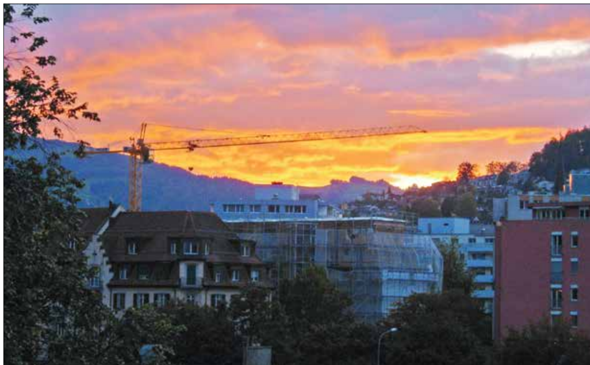
Auch wenn der Himmel über Luzern leuchtend schön sein kann, die Kirche ist in den Quartieren zu Hause.

Die Theologin und Mutter Katja Wißmiller zeigt auf, wo und warum Mütter unersetzlich sind. Seite 5