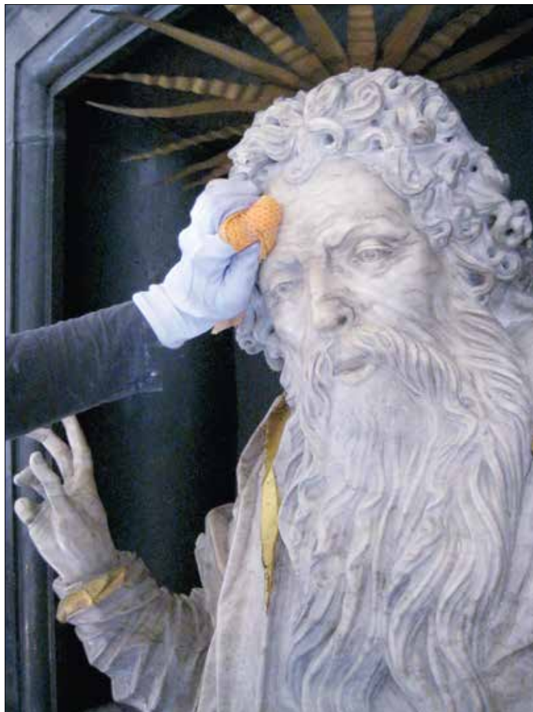
Die von Georg Guggenbühl († 1663) geschaffene Alabasterbüste Gottvaters auf dem Hochaltar der Hofkirche wird gereinigt.