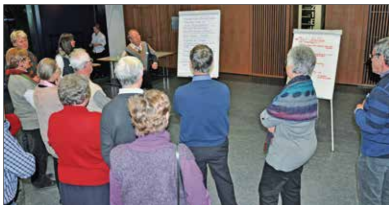
Gespannt und voller Erwartung bei der Vorstellung der neuen Ideen.

Unter diesem Motto standen die beiden World Cafés vom 16. Januar in der Pfarrei St. Paul. Hier eine erste Zwischenbilanz.