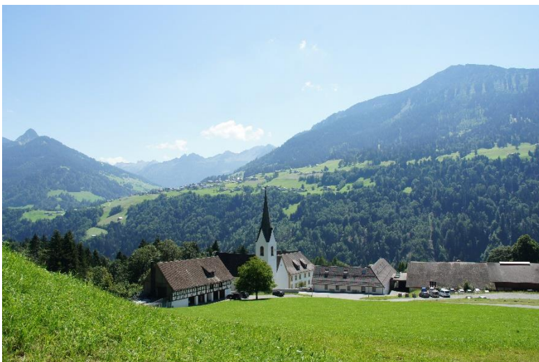
Propstei St. Gerold