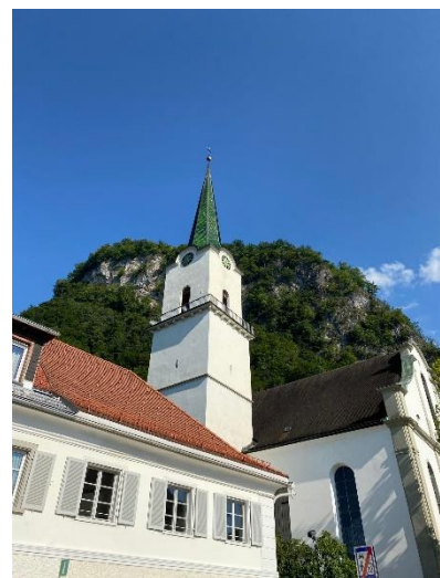
Kirche St. Karl