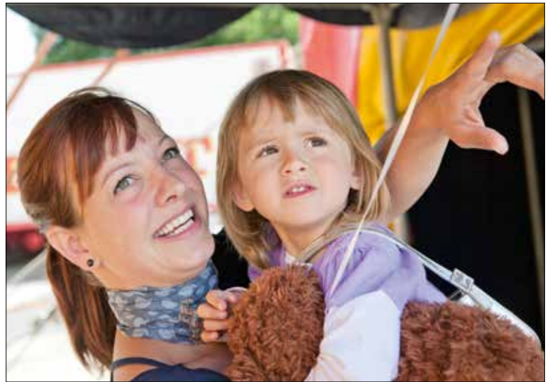
Familien in Notsituationen kann oft schon mit einer relativ kleinen finanziellen Unterstützung geholfen werden.

Die Geschichte von Frau K. und ihren Kindern ist nur ein Beispiel. Es zeigt aber auf, dass trotz der wertvollen staatlichen Absicherung auch bei uns in Luzern Menschen mit grossen finanziellen Sorgen leben. Vielfach sind Familien betroffen. Solche Notsituationen können für alle Betroffenen längerfristige Auswirkungen haben, denn Armut kann krank und einsam machen. «Die Stiftung Familienhilfe ermöglicht es mir, Familien schnell, unbürokratisch und gleichzeitig zielgerichtet zu unterstützen», so die zuständige Sozialarbeiterin. «Sie kann genau dort wirken, wo niemand zahlt.» Die Sozialarbeiterin be-