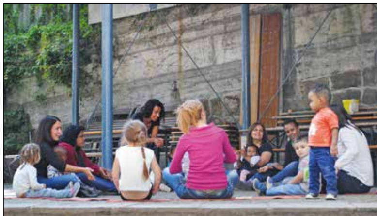
Frühförderung für die Kinder im Angebot «Türen öffnen» («Deutschkurs von Frauen für Frauen»).