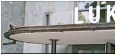
Zwitscherbar-Eingang beim Vögelgärtli.