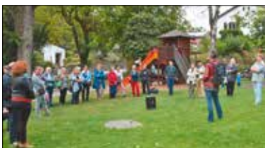
Zwischenhalt im Schildgärtli.

bp. Aus wechselnden Blickwinkeln zeigten am Samstag, 19. September Migrantinnen verschiedenster Herkunftsländer und Schweizerinnen aller Generationen das Maihof-Quartier. Rund 50 Frauen, Männer und Kinder folgten ihnen auf den Quartierrundgang mit dem Titel «Blickwinkel», besuchten Lieblingsplätze im Quartier und hörten persönliche Geschichten. Der Weg führte zum Rosenberg und in den Rank, an den Rotsee, ins Schildgärtli oder zu mehreren Lieblingsbäumen. Hinter dem Anlass standen der Verein «Zusammen leben Maihof-Löwenplatz», die «frauen maihof» und die Seniorinnen der Pfarrei St. Josef.