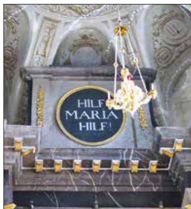
Medaillon über dem Hochalter der Mariahilfkirche.

Am Sonntag, 11. Oktober pilgern alle spanischsprachigen Missionen der Schweiz nach Einsiedeln. Deshalb fällt der 11-Uhr-Gottesdienst in der Mariahilf-kirche an diesem Sonntag aus.