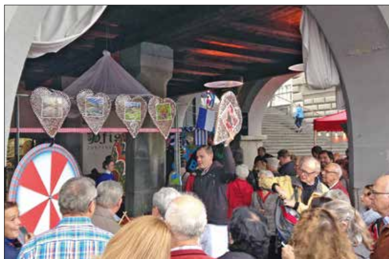
Die Kilbi ist ein wichtiges historisches Kulturgut, das es zu pflegen gilt. Am besten mit einem Besuch der Kilbi Unter der Egg, am Sonntag, 11. Oktober.

Die Kirchweihvergnügen waren jedoch nicht immer so harmlos, denn es gab im Kanton Luzern nicht nur die Hofkirche. In jeder andern Kirche und Kapelle wurde ebenfalls