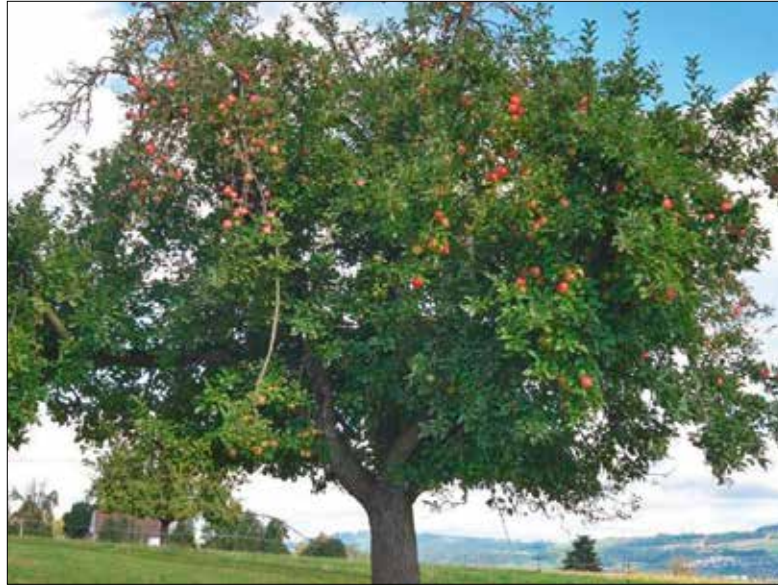
Ein Baum braucht starke Wurzeln und Äste, damit er viele Früchte tragen kann.

Zum 50-Jahr-Jubiläum pflanzen die Frauen des Frauenkreises auf dem Pfarreiareal einen Apfelbaum. Ein symbolischer, tiefgründiger Akt.