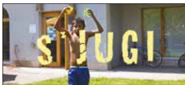
Titel des Kurzfilms zum Jubiläum.

us. Der Jugendtreff St. Karl an der Spitalstrasse 93 steht Mädchen und Buben ab der 4. Primarklasse offen. Hier treffen sie sich meist in geschlechter- und altersspezifischen Gruppen. Sie kochen, spielen, tanzen oder schalten vom Schulalltag ab. Unterstützt und begleitet werden die Kinder und Jugendlichen von Jugendarbeitenden der Katholischen Kirche Stadt Luzern. Diese nehmen die Bedürfnisse und Ideen der Kinder und Jugendlichen auf und setzen sie mit ihnen um. Informationen und Öffnungszeiten: www.kathluzern.ch/jugend