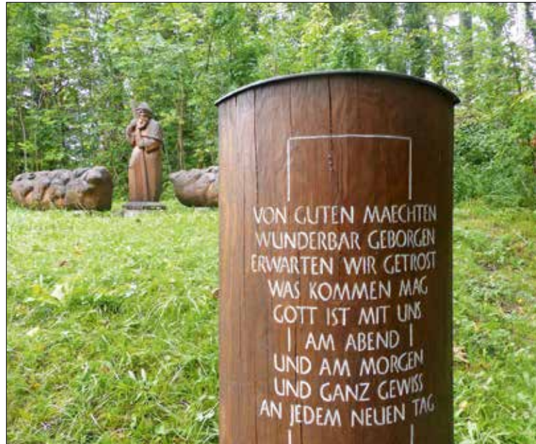
Eine der Stationen auf dem Lebensweg in Schwanden bei Brienz.

Der Lebensweg in Schwanden bietet die Möglichkeit aufzubrechen, sich Innerem zu stellen und offen für neue Wege zu sein.