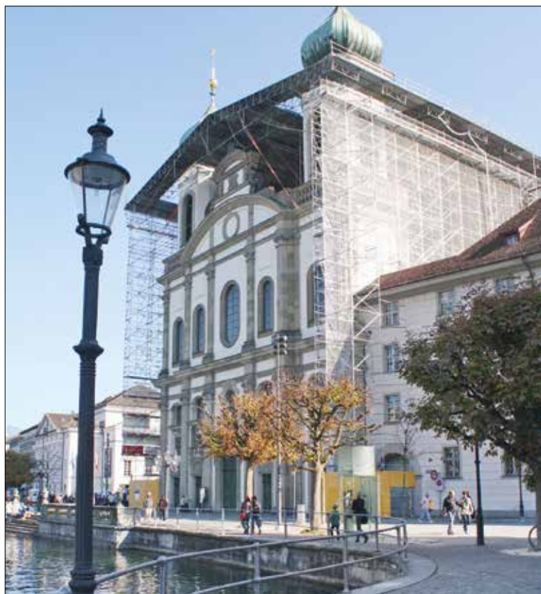
Die Jesuitenkirche ist noch immer eingerüstet.

Wort-Musik-Feier in Zusammenarbeit mit Studierenden und Dozierenden der Hochschule Luzern – Musik und der Hochschuleseelsorge «horizonte» Luzern Ab 28. Oktober bis 16. Dezember 2015, jeweils am Mittwoch, 12.15–12.45 Eintritt frei, Kollekte