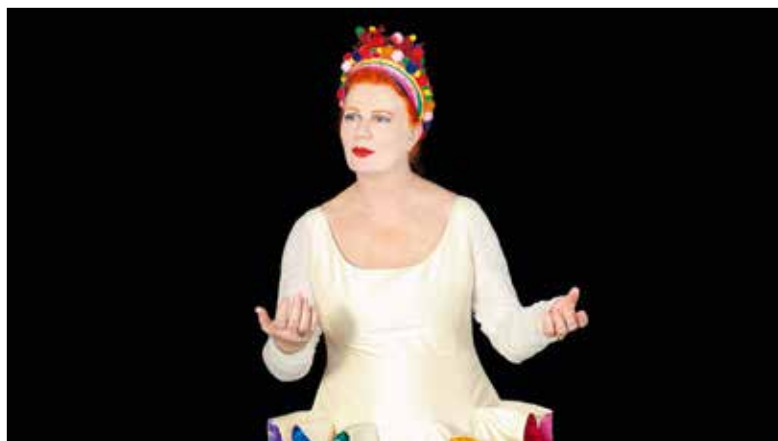
La Lupa mit ihrem neuen Programm «Colori».

La Lupa nimmt uns mit ihrem neuen Programm «Colori – i canti del mondo» mit auf eine Reise durch verschiedene Kulturen.